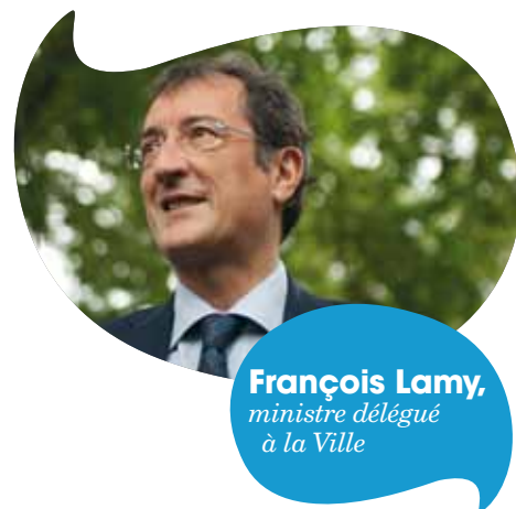
François Lamy, ministre délégué à la Ville